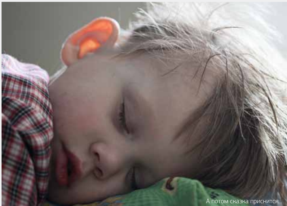
А потом сказка приснится...